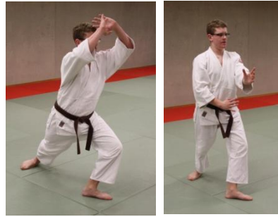
hiriki no yosei ichi