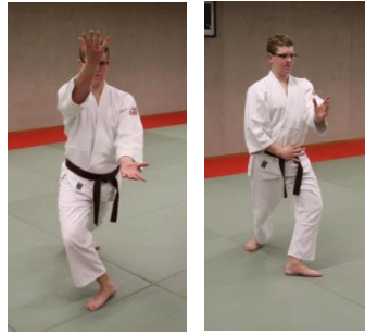
tai no henko ichi