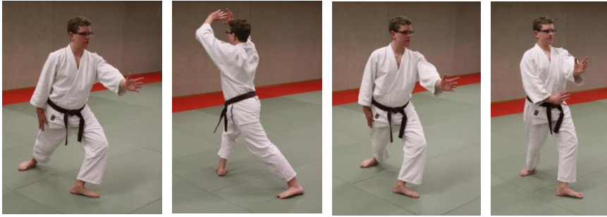
hiriki no yosei ni